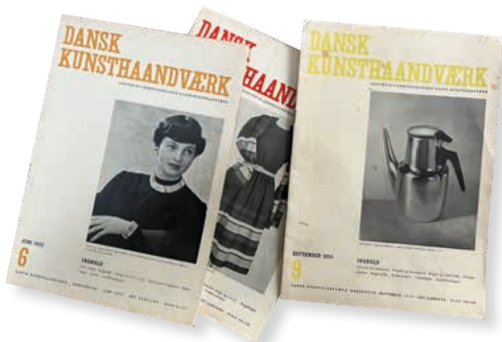
Tidsskriftet Dansk Kunsthåndværk.

udstillinger og artikler samt en tør konstatering af, at den danske designscene havde brug for penge til markedsføring, hvis man skulle have en chance for at gøre sig gældende internationalt, var medvirkende til, at der på dette tidspunkt i Danmark opstod et debatterende miljø, der på trods af markante meningsforskelle, virkelig tog dansk formgivning alvorligt - både som brugsgenstande, kunst og eksportvare.