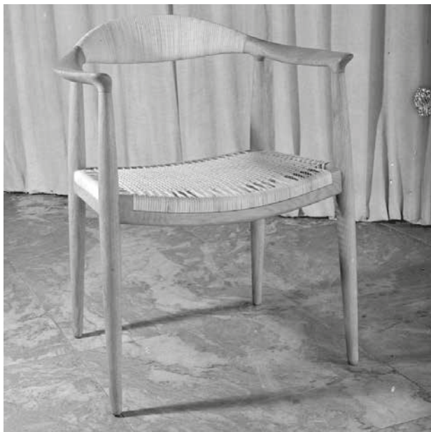
Den Runde Stol (JH501)